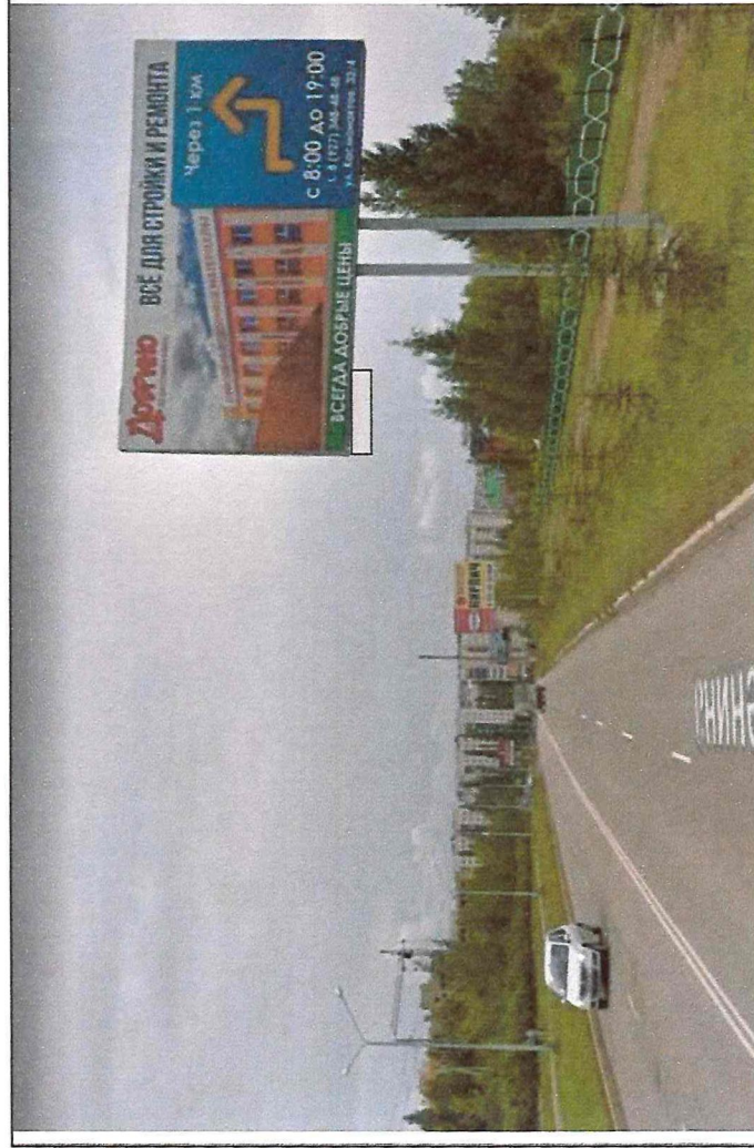
Сторона А 154